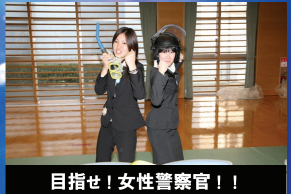
目指せ！女性警察官！！