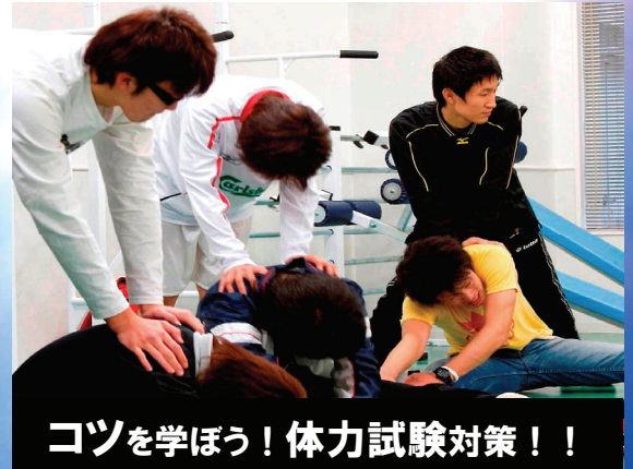
コツを学ぼう！体力試験対策！！

公務員試験も始まり、結果も出て来た頃かと思います。 1次に合格したけれど、2次対策はどうすれば良いのだろう ・・・と悩んでいる方も多いのではないのでしょうか？ 麻生公務員専門学校では、そんなあなたの為に、 『福岡県警B (高卒程度) 試験の面接・体力試験対策講座』を 行います！ 専任講師から合格基準を満たしているかを見てもらえる、 またと無い機会です。また、現役警察官(卒業生)からも合格 の秘訣を聞く事が出来ます。